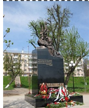
Мемориал в память воинов-освободителей и защитников Калинина