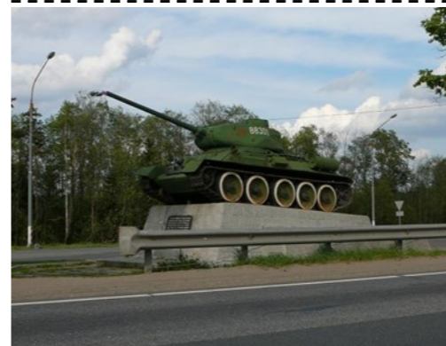
Монумент «Рубеж обороны»

Открыт в 1966 г. у развилки Санкт-Петербургского шоссе и окружной дороги Москва — Санкт-Петербург при выезде из Твери, в честь 25-й годовщины освобождения г. Калинина от немецко-фашистских захватчиков. Автор монумента — архитектор В.А. Титов. Создан в честь легендарного рейда танка Т-34 в октябре 1941 г.