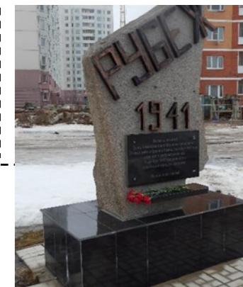
Стела у Горбатого моста

Открыт в микрорайоне «Радужный» 1 ноября 2011 г. к 70-летию освобождения Калинина. Монумент установлен на месте, где осенью 1941 г. были остановлены войска Вермахта.