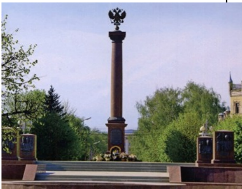
Памятник-стела «Город воинской славы»

Двенадцатиметровая гранитная колонна, увенчанная гербом России, расположена на постаменте в центре квадратной площади. На передней части постамента расположен картуш с текстом указа Президента РФ о присвоении Твери звания «Город воинской славы», с обратной стороны - изображён герб Твери. Город воинской славы — почётное звание Российской Федерации, присваиваемое отдельным городам Российской Федерации «за мужество, стойкость и массовый героизм, проявленные защитниками города в борьбе за свободу и независимость Отечества».